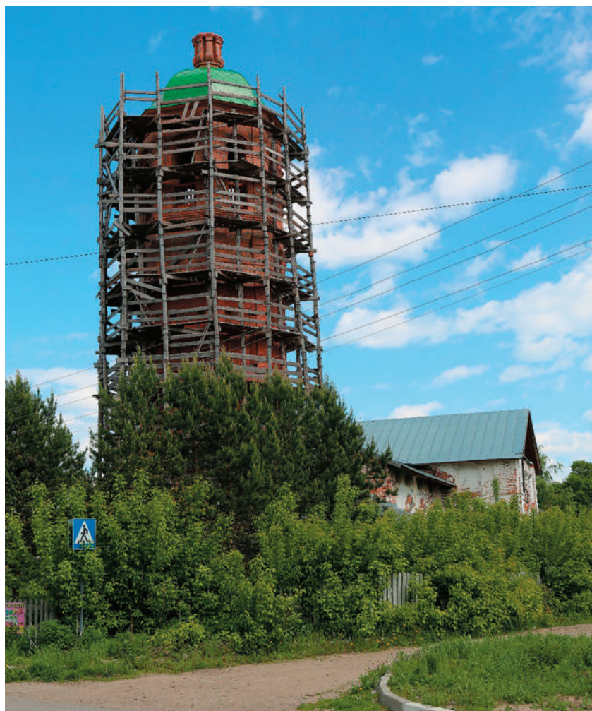
Храм в честь Спаса Нерукотворного Образа (1709-1713 гг.). г. Тобольск, ул. Революционная, 8 /фото – 11.06.2017 г./