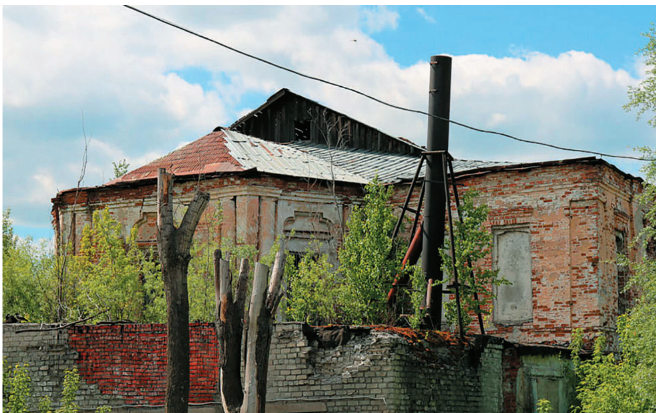
Церковь Казанской иконы Божией Матери в Знаменском монастыре (1730-1768 гг.) г. Тобольск, ул. Декабристов, 21 /фото – 11.06.2017 г./