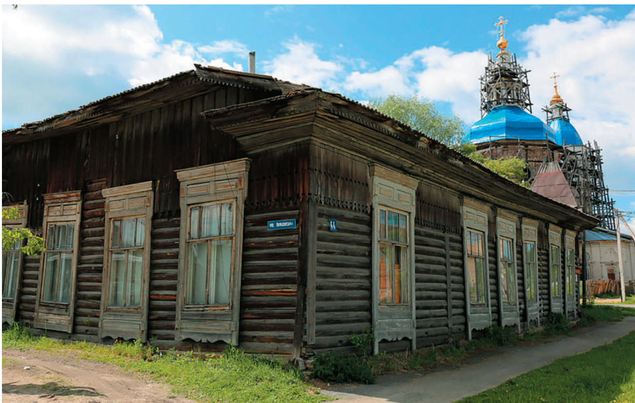
Старинный жилой дом рядом с Рождественским Храмом. г. Тобольск, ул. Семакова, 37 /фото – 11.06.2017 г./