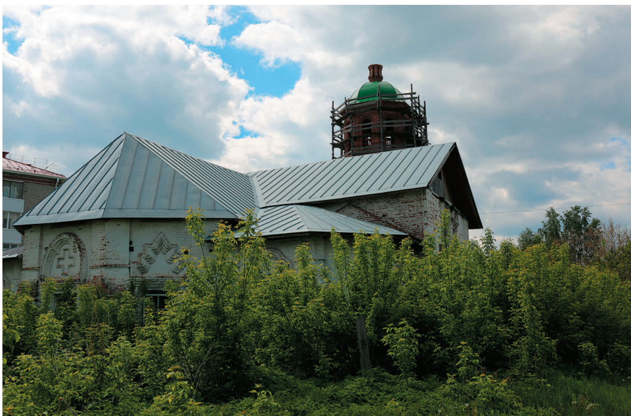
Храм в честь Спаса Нерукотворного Образа (1709-1713 гг.). г. Тобольск, ул. Революционная, 8 /фото – 11.06.2017 г./