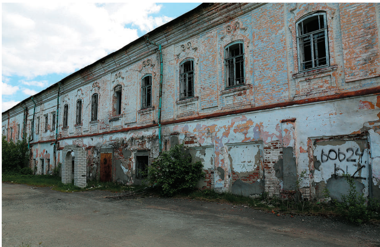
Знаменский монастырь (1623 г.). Объект – «Братско-настоятельский корпус с Казанской церковью» (1730-1768 гг.). г. Тобольск, ул. Декабристов, 21 /фото – 11.06.2017 г./