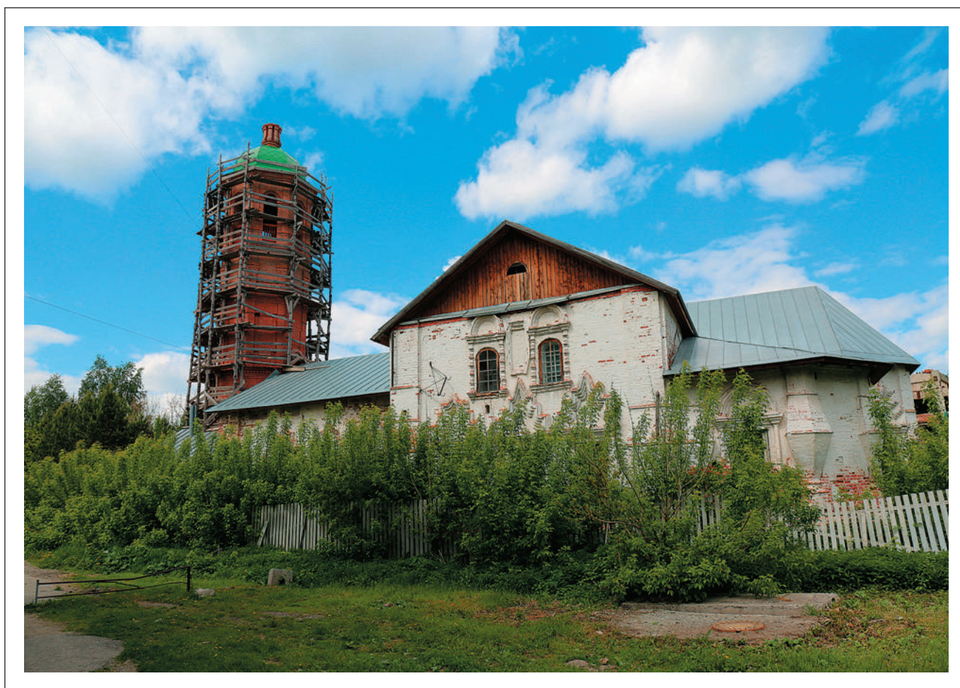
Храм в честь Спаса Нерукотворного Образа (1709-1713 гг.). г. Тобольск, ул. Революционная, 8 /фото – 11.06.2017 г./

По состоянию на 2012 год храм был законсервирован для будущей реставрации.