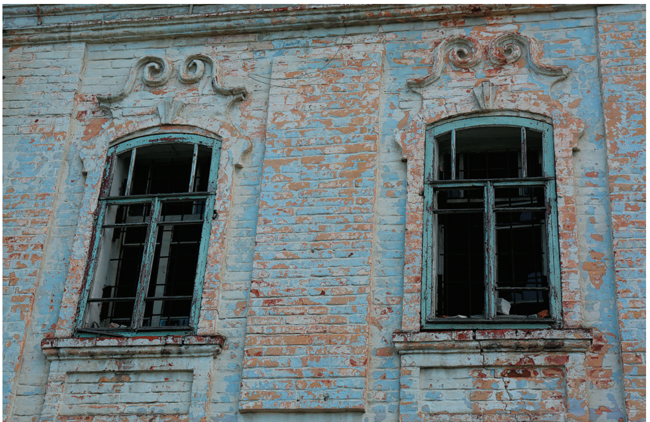
Знаменский монастырь (1623 г.). Объект – «Братско-настоятельский корпус с Казанской церковью» (1730-1768 гг.). г. Тобольск, ул. Декабристов, 21 /фото – 11.06.2017 г./