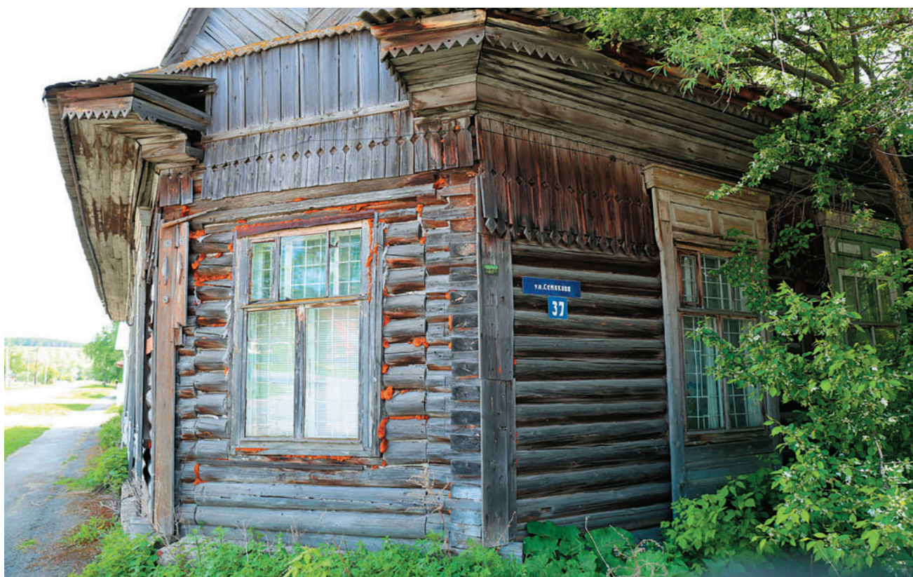
Старинный жилой дом рядом с Рождественским Храмом. г. Тобольск, ул. Декабристов, 40 /Семакова, 37/ – фото 11.06.2017 г.