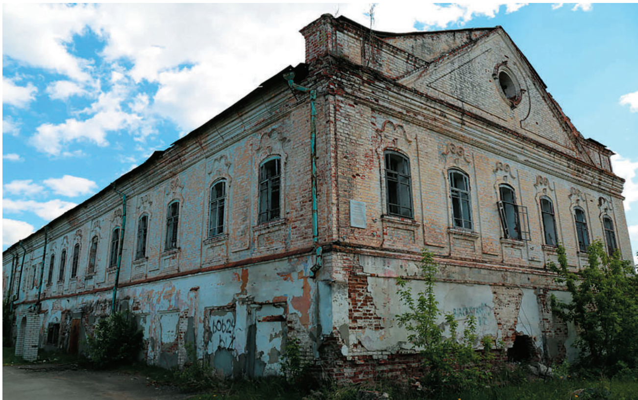
Братско-настоятельский корпус Знаменского монастыря (1730-1768 гг.) фото – 11.06.2017 г.