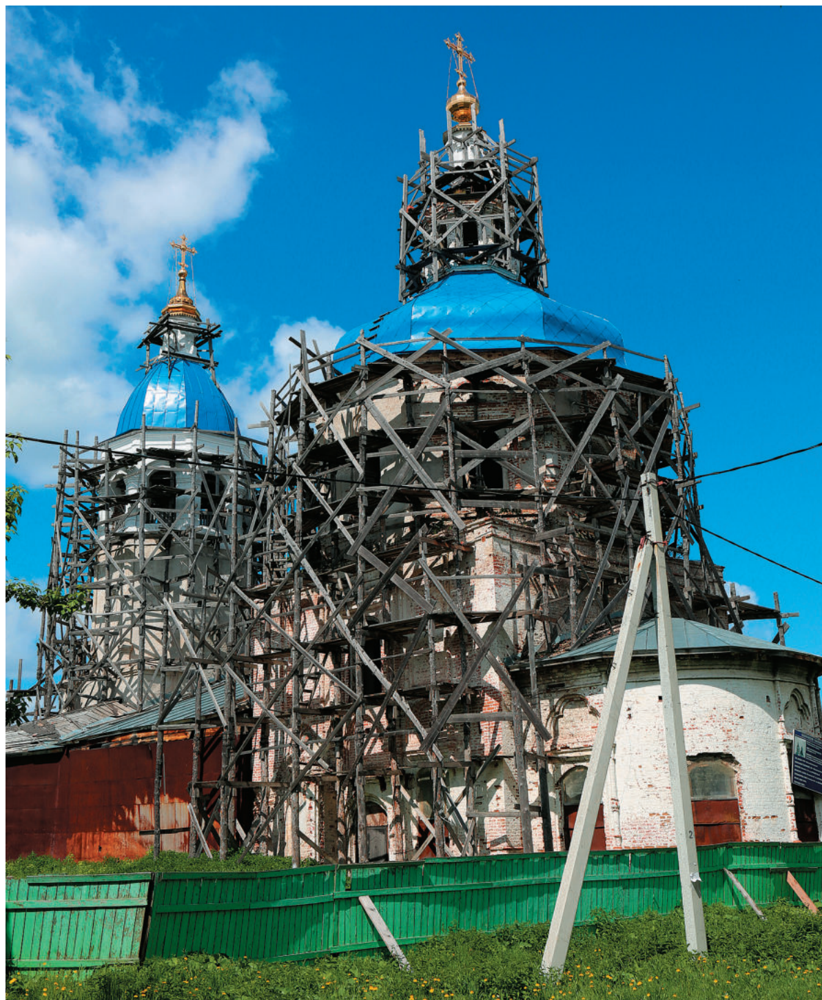
Храм в честь Рождества Христова (1748-1761 гг.). г. Тобольск, ул. Декабристов, 42 /фото – 11.06.2017 г./

Начиная с 2012 года обитель находится в процессе неспешной реставрации.