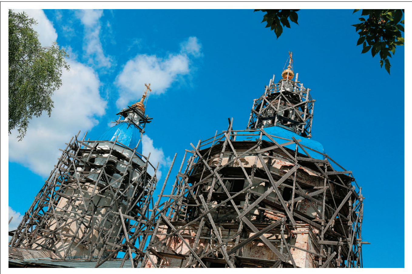
Храм в честь Рождества Христова (1748-1761 гг.). г. Тобольск, ул. Декабристов, 42 /фото – 11.06.2017 г./