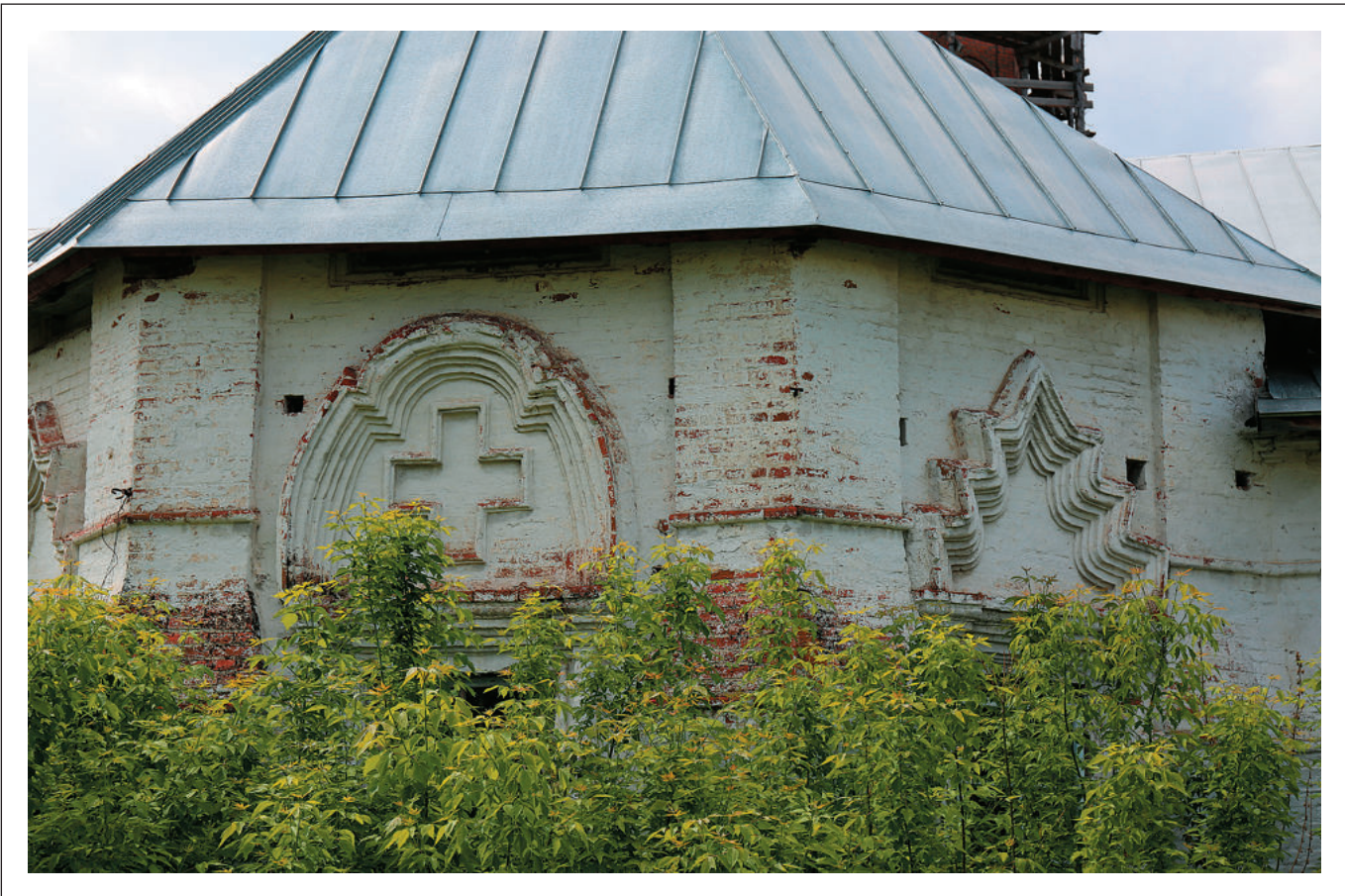
Храм в честь Спаса Нерукотворного Образа (1709-1713 гг.). г. Тобольск, ул. Революционная, 8 /фото – 11.06.2017 г./