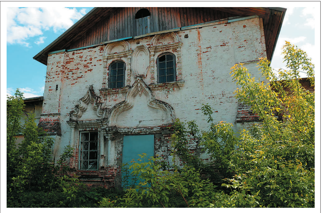
Храм в честь Спаса Нерукотворного Образа (1709-1713 гг.). г. Тобольск, ул. Революционная, 8 /фото – 11.06.2017 г./