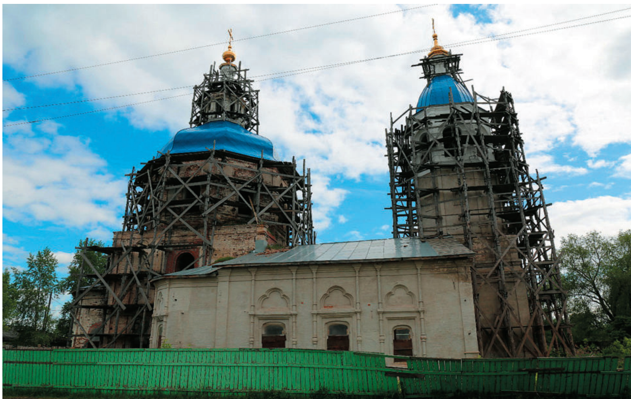
Храм в честь Рождества Христова (1748-1761 гг.). г. Тобольск, ул. Декабристов, 42 /фото – 11.06.2017 г./