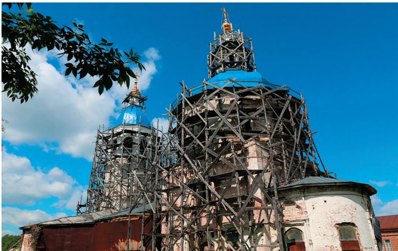
Храм в честь Рождества Христова (1748-1761 гг.). г. Тобольск, ул. Декабристов, 42 /фото – 11.06.2017 г./